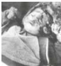
Ребенок, которой, пытали армяне.

Азербайджанские официальные лица, вернувшиеся с места трагедии, привезли тела трех детей, с их голов был снят скальп. В местной мечети лежат 6 тел с отмороженными конечностями. Их лица почернели от холода.