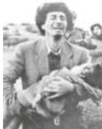
Убитый горем отец