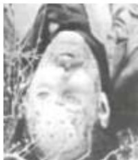
Зверски убитый житель Ходжалы.