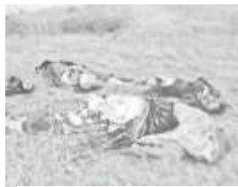
Жестоко убитые жители Ходжалы.

Более 60-ти тел, включая женщин и детей, было найдено в горах Нагорного Карабаха. Это подтверждает тот факт, что армянские войска убивали азербайджанцев, пытавшихся спастись бегством. Сотни пропали без вести.