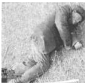
Убитый армянами пожилой мужчина.

Ледящие душу кадры, показывающие множество окоченевших тел, разбросанных по заснеженным холмам, жестоко убитых женщин и детей, заставляют плакать людей, сумевших сбежать и спасти свои жизни.