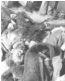
Мирные жители Ходжалы.

Ходжалы - азербайджанский населенный пункт с населением 6000 человек находился в районе, заселенном преимущественно армянами.