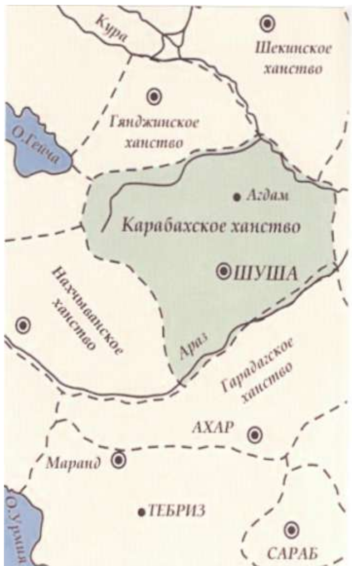
Карта Азербайджана. Вторая половина XVIII века.