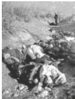
Зверски убитые мирные жители

Но эти планы потерпели неудачу. Захватчики разрушили Ходжалы и с особой жестокостью расправились с мирным населением города.