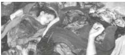
Изувеченные трупы мирных жителей.