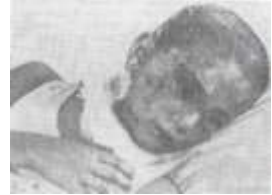
Ребенок которого пытали армяне

Население занималось сельским хозяйством, виноградарством, пчеловодством и выращиванием зерна. Здесь располагались текстильные фабрики, две средние школы. В свете событий последних 54 лет как семьи турок-месхетинцев - переселенцев из Ферганы (Узбекистан), так и азербайджанцы, изгнанные из Армении, нашли убежище в этом городе. В связи с этим развивалось строительство ветвей крупных индустриальных предприятий Азербайджана, загородных домов.