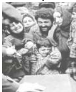
Боль и слезы Ходжалы.

Конгрессмен сказал: “До февраля 1992 года Ходжалы был небольшим городом в Азербайджане. Сегодня его не существует. Слово “Ходжалы” превратилось для всех азербайджанцев и населения региона в символ горя, скорби и жестокости. 26 февраля 1992 года армянские вооруженные силы при помощи российского военного полка не только захватили, но и полностью разрушили этот город. Армяне беспощадно истребили 613 человек, уничтожили целые семьи, взяли в плен 1275 человек, превратили в калек 1000 лиц гражданского населения. 150 человек считаются пропавшими без вести”. Обнародовав эти факты, конгрессмен Дэн Бартон,