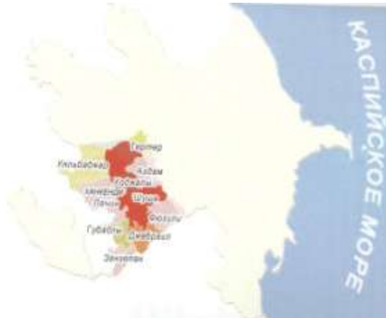
Оккупированные территории Азербайджана