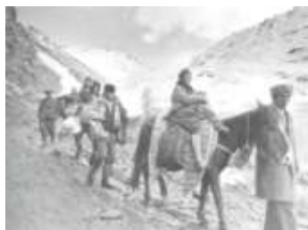
Беженцы из Ходжалы.

Бомбардировка артиллерией началась 25-го февраля в 23:00. Бараки, расположенные в районе жилой застройки и заставах были разрушены в первую очередь. Вход единиц пехоты в город был совершен с 1:00 до 4:00 утра 26 февраля. Последнее сопротивление было сломлено к 7:00 утра. В результате нападения в город большое количество мирных жителей было убито.