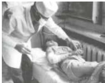
Молодая девушка, которую пытали армяне.

Армения всё ещё отрицает свою причастность к убийству 1000 азербайджанцев в городе Ходжалы и мужчин, женщин и детей, пытавшихся спастись от резни, сбежав через заснеженные горы.