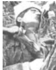
Мирный житель Ходжалы.

Азербайджанское телевидение в воскресенье показало приблизительно 10 трупов, включая тела нескольких женщин и детей, в импровизированном морге в Агдаме. Редактор главной телестанции Баку сказал, что пока доставлено только 180 тел. Пилот вертолёта, пролетавшего над местом трагедии, как сообщают, видел другие трупы, в то время как Би-Би-Си, цитируя французского фотографа, сообщает, что он насчитал 31 мёртвых тел, включая женщин и детей, некоторые были убиты выстрелом в голову с близкого расстояния.