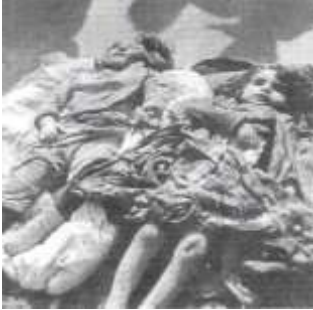
Убитые армянами тела которых были изуродованы после смерти

На некоторых телах обнаружено множество Убитые армянами дети, тела которых были ран, одна из которых была в голове, это говорит о том, что раненых людей убивали. Некоторые дети были найдены с отрезанными ушами, с левой части лица пожилой женщины была содрана кожа; мужчины были скальпированы. Были найдены полностью обрубленные тела. Когда мы в первый раз приехали на место убийства 28 февраля, сопровождаемые двумя военными вертолетами, мы увидели из воздуха территорию площадью 1 километр, которая практически полностью была покрыта телами...”