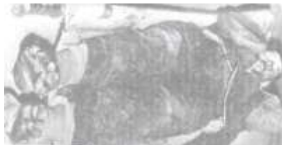
Убитый житель Ходжалы, которому содрали кожу ног.

Нападавшие убили большую часть солдат и добровольцев, защищавших женщин и детей. Затем они направили свои ружья на пытавшихся бежать, напуганных людей.