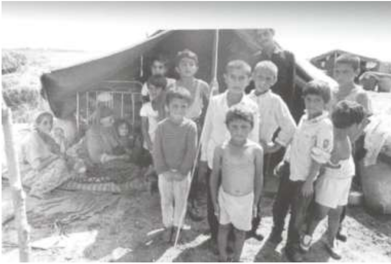
Взгляд в пустоту