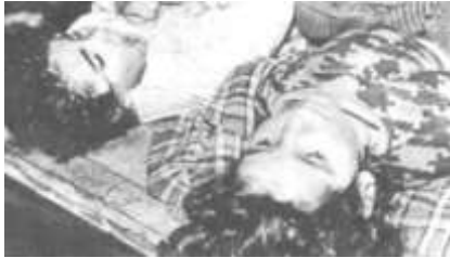
Дети, которых пытали перед смертью.

“Как исполнительный директор Комиссии по правам человека/Хельсинки (бывшая Комиссия Хельсинки) я хочу ответить на заявление Министра Иностранных Дел от 3 марта относительно массового убийства азербайджанских мирных жителей в городе Ходжалы Нагорного Карабаха. В нем министр утверждает, что народный Фронт Азербайджана был ответственным за убийство мирных жителей, подтверждая свое заявление ссылкой на интервью с бывшим президентом Аязом Муталибовым и, что невероятно, на отчет нашей организации за 1992 год.