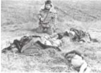
Убитая армянами семья.

В ночь с 25 на 26 февраля вооруженные силы Армении осуществили захват Ходжалы при помощи тяжелой техники и личного состава пехотного полка 366 бывшего Советского Союза. Нападению на город предшествовала массивная стрельба с использованием артиллерийского оружия, тяжелой военной техники, начатая 25 февраля. В результате в городе начался пожар и к пяти часам утра весь город был в огне. Оставшееся в городе население (около 2500 человек) было вынуждено оставить свои дома в надежде найти дорогу к Агдаму - районному центру и ближайшему месту,