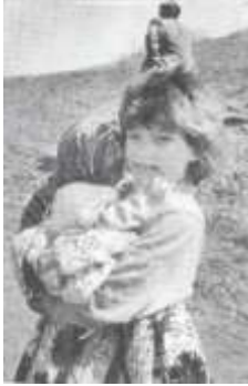
Оставшиеся в живых дети Ходжалы

Нападение армян на Ходжалы было predetermined стратегическим положением города. Город с населением в 7000 человек расположен в 10 километрах к югу от Ханкенди. Ходжалы, расположенном на пути Агдам-Шуша, Аскеран - Ханкенди, есть аэропорт, единственный в