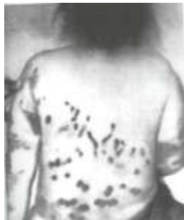
Женщина, которую пытали армяне.

Беженцы, которым удалось покинуть Ходжалы, город с населением 6000 человек, расположенный к северу от столицы анклава, Степанакерта, сообщили о том, что 500 человек, включая женщин и детей, были биты во время нападения. Невозможно было приблизительно подсчитать количество погибших. Глава мечети города Агдам, Сайд Садыков, сказал, что беженцы из Ходжалы составили список, в котором числилось 477 жертв трагедии. Официальные лица в Баку, столице Азербайджана, сообщили о 100 убитых в Ходжалы, в то время как в Ереване говорят лишь о 2 азербайджанцах, убитых во время нападения. Из