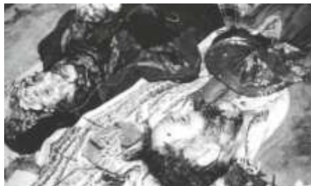
Семья убитая армянами