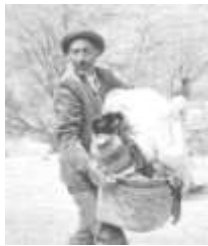
Беженцы из Ходжалы.

В сообщении МЕМОРИАЛ ХЬЮМАН РАЙТС ВОТЧ ЦЕНТР, говорится о массовых нарушениях прав человека во время оккупации города