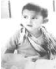
Ребенок, которого пытали армяне.

Азербайджанские официальные лица сообщили, что около 1000 азербайджанцев были убиты, а также, что армянские террористы вырезали мужчин, женщин и детей, бегущих поперёк заснеженных торных перевалов.